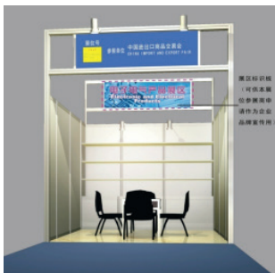
标摊展位增加标识板效果图

(2) 现场申报：为方便您的申报工作的顺利进行，请您在开展前两天的 12:00 前到客户服务中心现场服务点办理申请和交费。现场交费完成后，请将所需输出的电子文档发至指定邮箱 chenweijuan@cfedc.net 。